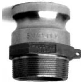
SFS standardin mukainen kiinteä täyttöliitin